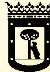
Escudos oficiales de Madrid entre 1850 y 1967, y en la actualidad.